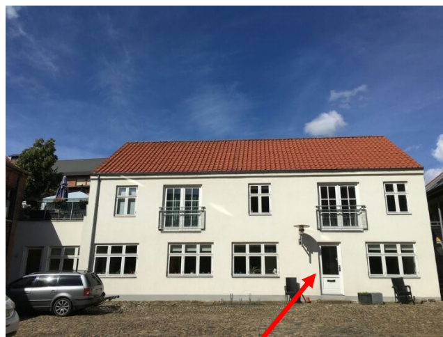
Indgang til Samværstilbuddet